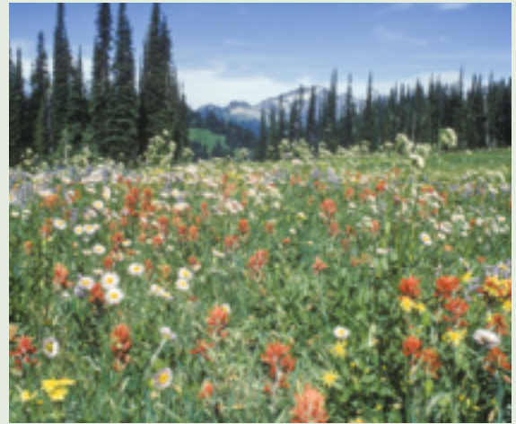
Massif floral dans une prairie de la zone subalpine supérieure, Parc national du Mont-Revelstoke

En février 2017, le gouvernement du Canada a lancé l'initiative « En route vers l'objectif 1 du Canada » dans le but de coordonner et d'encourager les efforts déployés par tous les partenaires concernés. Cette initiative visait à créer de nouvelles conditions susceptibles d'améliorer les résultats quantitatifs et qualitatifs en matière de protection des terres et des eaux. Les éléments qualitatifs examinés sont notamment l'efficacité de la gestion dans les parcs et la connectivité entre les parcs.