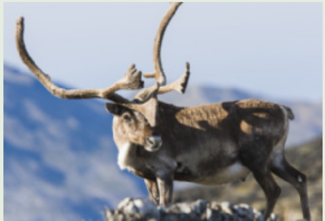
Caribou à la baie Ramah dans le parc national des Monts-Torngat

Il a fallu plus de dix ans pour planifier le rétablissement de cette espèce. Les prochaines étapes importantes pour Environnement et Changement climatique Canada sont la mise en œuvre des activités de rétablissement ainsi que l'évaluation des mesures prises pour protéger l'habitat essentiel et la présentation de rapports à cet égard.