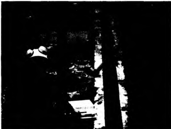
Cunetas que conducen las aguas desbordadas al alcantarillado. Momento de desborde del tanque de homogeneización.