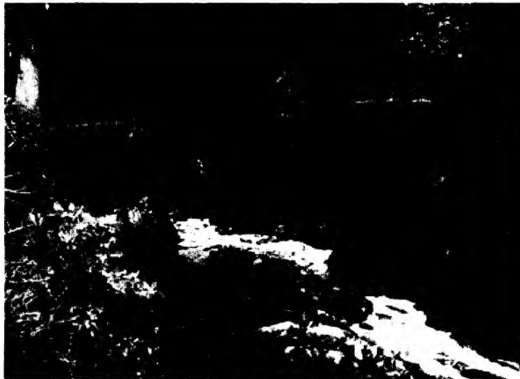
Quebrada Calicanto con descargas del camal metropolitano

Con oficio 8743 de 13 de noviembre de 2012, la Secretaria de Ambiente, Enc., remitió al equipo de control los resultados obtenidos en los análisis de laboratorio: