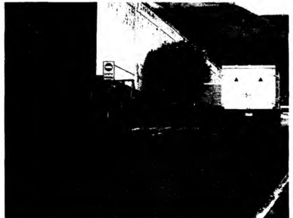
Pozo 7. Operador de la planta de tratamiento de aguas residuales cierra la compuerta de acceso de las aguas a la planta de tratamiento y abre la compuerta de paso al alcantarillado público (pozo 5)