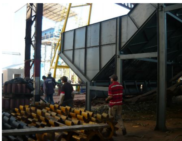
No es frecuente el uso de casco por parte de los obreros y empleados de la Planta Petropar de M. Jose Troche, tal como se observa en las fotos.