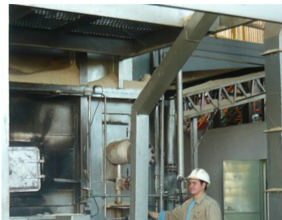
Obrero trabajando en la sección de calderas sin los equipos de protección visual ni tapabocas.