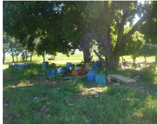
En las fotos se observan la forma de disposición final de los desechos y residuos de la Planta Petropar en Villa Elisa.