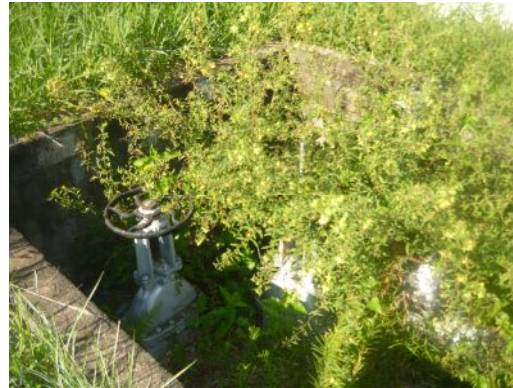
Tubos y cañerías de la Planta Petropar de Villa Elisa en total descuido y abandono.