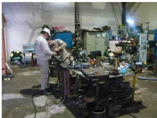
Empleados trabajando en la sección metalúrgica sin los equipos de protección visual, casco y guantes.