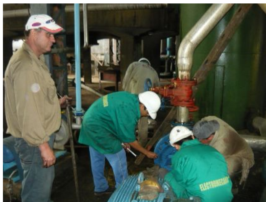
Empleados trabajando: Algunos sin uso de cascos y guantes.